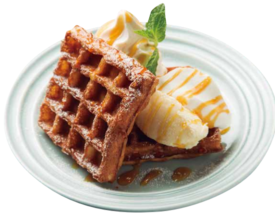
塩キャラメルワッフル 820 Salted Caramel Waffle

香り高く焼き上げたワッフル。 キャラメルのほろ苦甘さと、 塩の絶妙なハーモニーをお楽しみいただけます。